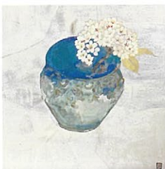
澁澤星 咲き誇る 日本画

研ぎ澄まされた感性とセンスで人物、動植物・風景などを描く。明確な輪郭線に頼らず具象と抽象を絶妙なバランスで織り交ぜた作品は、現実と幻想の間にいるような不思議な感覚に誘う。明るい夏の静物などのシリーズを中心に、「光」に焦点を当てた新作を披露する。現在、日本美術院院友。