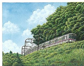
松本忠 「夏空へのカーブ」京王電鉄 高尾線 高尾～高尾山口 水彩画

全国各地を走る列車と四季折々の風景を描く鉄道風景画家・松本忠。今展にあわせて描き下ろした京王電鉄を題材にした作品のほか、原画・版画約50点を展示。「誰かのふるさとの駅をつないでいる鉄道がいつまでも引き継がれてほしい」との思いを込めた水彩画を展示。