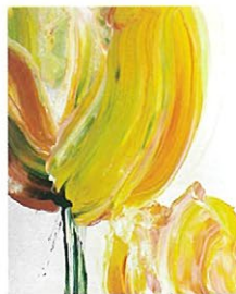
木下友梨香 チューリップ パネル、ペンキ

今後の活躍が期待される若手を支えようとコロナ禍にスタート。5回目の今回は小津航、木下友梨香、竹内昌二、中比良真子、水野悠衣、村田奈生子、村本真吾の油彩画、日本画、立体約40点を展観する。