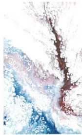
轟悠 いつまでも アクリル

宝塚でトップスターとして活躍していた轟悠が、退団後、作家活動をスタート。「ポーリング」というメディアウムにアクリル絵具を流し込んで描く技法で描いた作品約60点を発表。