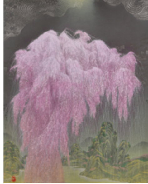
智内 兎助 Kyosuke TCHINAL