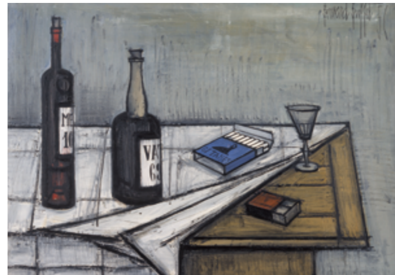
ベルナール・ビュッフェ Bernard BUFFET