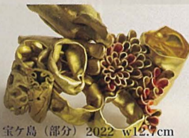
宝ヶ島 (部分) 2022 w12.7cm

〒104-0031 東京都中央区京橋 2-12-2 三貴ビル 2 階 TEL 090-3451-8637 www.megumuart.com