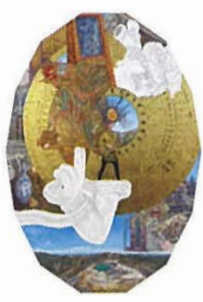
「蔵王権現 天球音楽祭」2024年 油彩、箔、鉛筆、白亜下地、綿布、パネル 230×165cm

ギャラリー広田美術 TEL.03 (3571) 1288 中央区銀座7-3-15 ぜん屋ビル1F