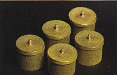
魚々子筒 2024 w4.0cm