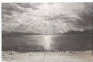
「とうやの冬日差」2024年 チョーク、黒板 41.0×60.6cm

Gallery MUMON TEL.03 (6226) 2555 中央区銀座4-13-3