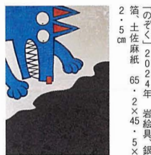
「のぞく」2024年 箔、土佐麻紙 65・2×45・5x

四季彩舎 TEL.03(3535) 2131 中央区京橋2-11-9 西堀11番地ビル2F