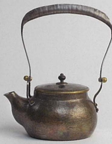
銚子 2022 w16.6×h20.0cm