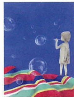
「野口雨情『うぐいす』裏表紙」

ナカジマアート TEL.03 (3574) 6008 中央区銀座5-5-9 アペビル3・5F