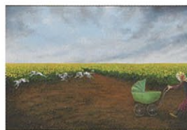
「麦そよぐ地まで」(部分)

緻密な油彩や蜜蠟転写画を制作する榎本香菜子の個展。養蜂家が亡くなると養蜂箱に黒いリボンをかけ、蜂に死を告げるという伝統「Telling The Bees」をテーマに、心を寄せて描いた油絵20点と蜜蠟転写画10余点を展覧する。