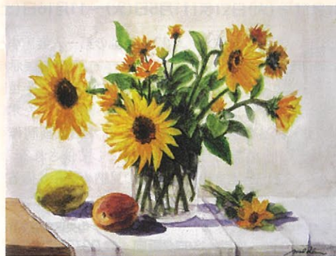
「秘められた光輝」水彩画 6号 F

中央区銀座7-2-6 銀座アステルビル1F 創英ギャラリー ☎03(6274)6698